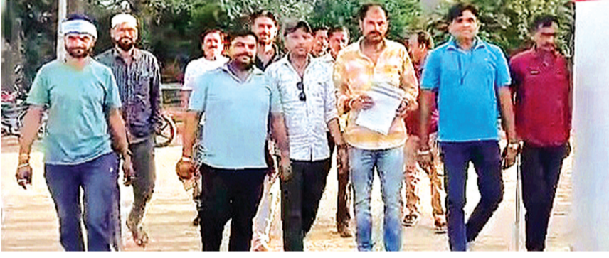
हरिभूमि न्यूज >>>ललितपुर

मड़ावरा क्षेत्र में पत्रकार के खिलाफ लगाए जा रहे आरोपों के विरोध में ग्रामीण पत्रकार एसोसिएशन के बैनर तले पत्रकार एकजुट नजर आए। सभी पत्रकार मड़ावरा कोतवाली पहुंचे और प्रभारी निरीक्षक मड़ावरा को ज्ञापन सौंपकर मामले में निष्पक्ष जांच और दोषियों के खिलाफ कड़ी कार्रवाई की मांग की। पत्रकारों ने स्पष्ट शब्दों में कहा कि निष्पक्ष और निर्भीक पत्रकारिता को दबाने की कोशिश किसी भी हाल में बर्दाश्त नहीं की जाएगी। उनका कहना था कि सच्चाई उजागर करने वाले पत्रकारों को बदनाम करने की