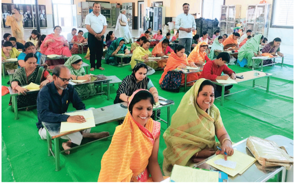
हरिभूमि न्यूज >>>ललितपुर